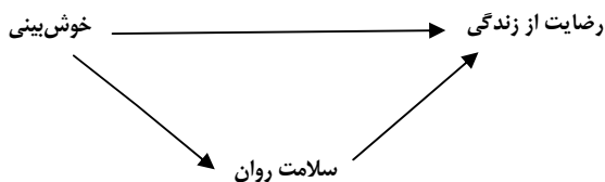
شکل ۱- الگوی (۱) پژوهش

این یافته‌ها پایه شکل‌گیری پژوهش حاضر است. پژوهش حاضر با هدف بررسی ساز و کارهای اثرگذاری خوش‌بینی بر رضایت از زندگی با افزایش سلامت روان انجام شد. الگوی پیشنهادی این پژوهش (شکل ۱)، بر این فرض استوار است که خوش‌بینی به واسطه افزایش سلامت روان، رضایت بیشتر از زندگی را در پی دارد.