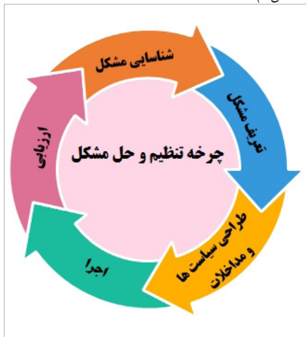
شکل ۲: چرخه تنظیم و حل مشکل

ساختار مشارکت بین‌بخشی از طریق یک فرایند مشارکتی و تصمیم‌گیری جمعی اقدام به شناسایی و تعریف مشکلات، طراحی و اجرای مداخلات برای حل این مشکلات و درنهایت ارزیابی مداخلات می‌نماید؛ فرایند مذکور به صورت چرخه‌ای عمل نموده، در هر مرحله از فرایند، امکان بازگشت به مرحله قبل وجود دارد (شکل ۲).