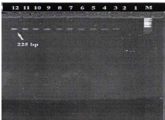
شکل ۲ - نتایج PCR در مورد رقت‌های مختلف PCR