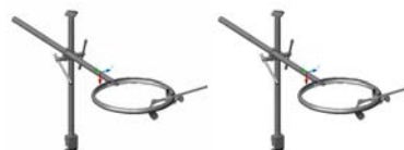
شکل ۱- طرح کلی مجموعه رترکتور

مکانیسم اتصال ستون عمودی به ریل تخت جراحی؛ مکانیسم اتصال بازوی افقی به ستون عمودی؛ مکانیسم اتصال راهنمای تیغه به حلقه نگهدارنده؛ مکانیسم اتصال دنباله تیغه به راهنمای تیغه.